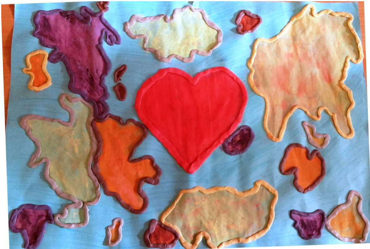
Autor: Oliwia Mańka