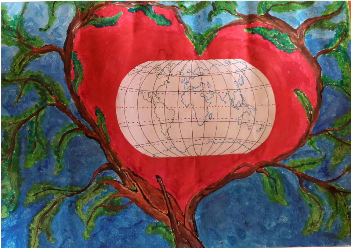
autor: Natalia Filipczuk